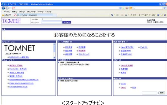
<スタートアップナビ>

ログイン画面 (全社ポータル=スタートアップナビ) の冒頭に掲げられているのは、巴商会様の社是『お客様のためになることをする』。そして画面左下には、グループ会社にもすぐ直接リンクできるようバグループサイトリンクが配置されている。中央の列には「ニュース情報サイト」「今日は何の日?」「今日生まれた有名人」が配置され、また右列の「鉄道・飛行機サイト」には「駅すばあと」や「全日空・日本航空」へのリンクが設けられて交通ルートの検索がしやすくなっており、実務的に非常に使いやすいログイン画面になっている。