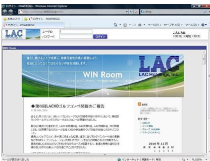
【ログイン画面 (Win Room)】

それに対し、ナビビューは仕事に関する公式ページですね。グループとはいえ以前は別々の場所で仕事していた所属会社の異なる社員たちが、いまは同じ場所で、同じようにログインし、同じ画面を見て、グループ全員が1つのサーバにアクセスして・・・、というのは何か壮観というか、ちょっと不思議な感じがします。しかし、確固とした情報共有基盤が稼働している実感がありますね」