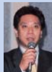
ディサークル株式会社 代表取締役