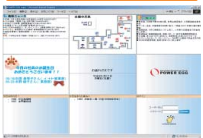
図 POWER EGGを活用したトップ画面例

パルコでは、さらなる成長のため、現在を「第2創業」と位置づけ、パルコ本来の強みである「商業施設のプロデュース